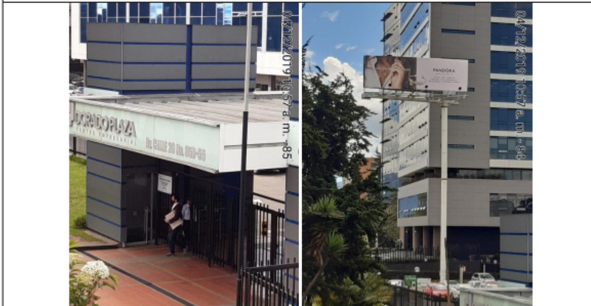
Foto No.3 y 4: Nomenclatura del predio y vista general de la estructura de la valla tubular en buenas condiciones y estable, instalada en la Av. Calle 26 No. 84A-55 (Dirección registrada) y/o Av. Calle 26 No. 85D-65 (dirección catastral), orientación Oeste-Este .