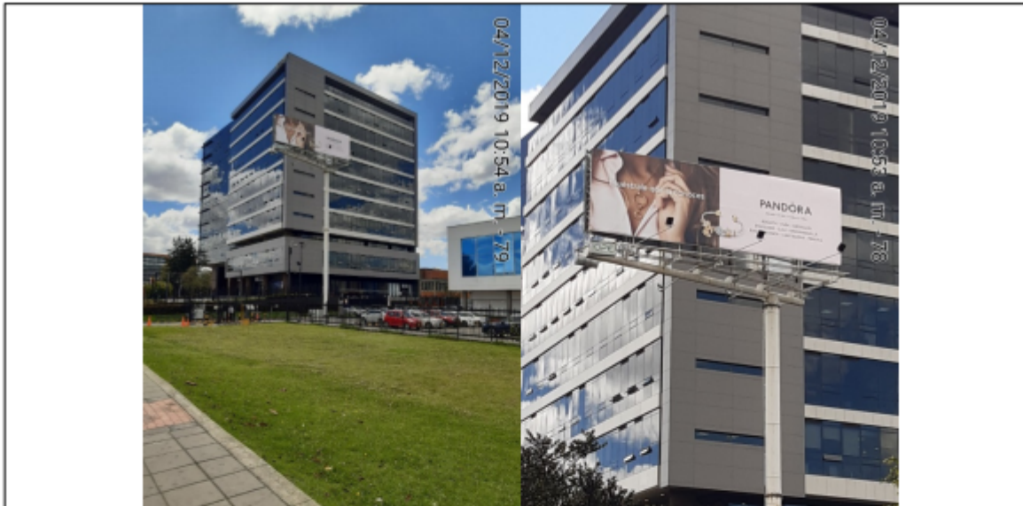
Foto No.1 y 2: Vista panorámica del predio y de la estructura de la valla ubicada en la Av. Calle 26 No. 84A-55 (Dirección registrada) y/o Av. Calle 26 No. 85D-65 (dirección catastral), orientación Oeste-Este .